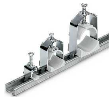
Скобы для крепления кабеля диаметром 6 - 64 мм